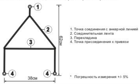
Рис. 3. Совместимое оборудование