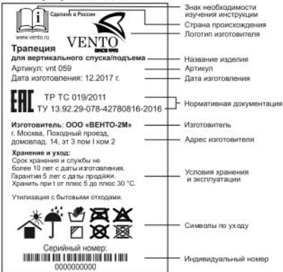
Рис. 1. Маркировка изделия

Перед использованием данного СИЗ Вы обязаны: - Прочитать и понять инструкцию по эксплуатации. - Пройти тренировку по его применению под руководством квалифицированного инструктора. - Познакомиться с потенциальными возможностями и ограничениями по его применению. - Осознать и принять вероятность возникновения рисков, связанных с применением СИЗ. Игнорирование этих предупреждений может привести к серьезным травмам или даже смерти.