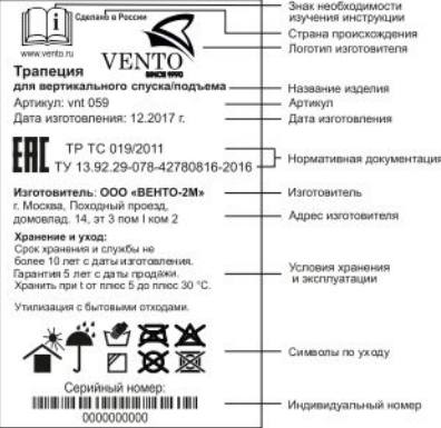
Рис. 1. Маркировка изделия

Перед использованием данного СИЗ Вы обязаны: - Прочитать и понять инструкцию по эксплуатации. - Пройти тренировку по его применению под руководством квалифицированного инструктора. - Познакомиться с потенциальными возможностями и ограничениями по его применению. - Осознать и принять вероятность возникновения рисков, связанных с применением СИЗ. Игнорирование этих предупреждений может привести к серьезным травмам или даже смерти.