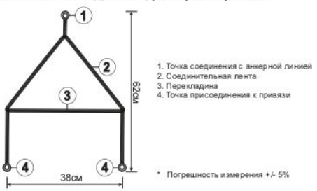
Рис. 3. Совместимое оборудование