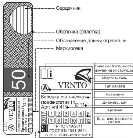
Рис. 1. Составные части и маркировка изделия

EAC - Единый знак обращения продукции на рынке государств-членов Таможенного союза. Знак соответствия требованиям Технического регламента Таможенного союза ТР ТС 019/2011 - Технический регламент Таможенного союза «О безопасности средств индивидуальной защиты» ГОСТ EN 1891-2014 - ССБТ. СИЗ от падения с высоты. Канаты с сердечником низкого растяжения. ТУ 32.30.15-088-42780816-2017 «Канаты статические «Профистатик» VENTO»