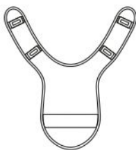
vnt 1280 Накладки ножные «Комфорт»