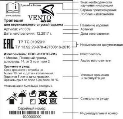
Рис. 1. Маркировка изделия

Перед использованием данного СИЗ Вы обязаны: - Прочитать и понять инструкцию по эксплуатации. - Пройти тренировку по его применению под руководством квалифицированного инструктора. - Познакомиться с потенциальными возможностями и ограничениями по его применению. - Осознать и принять вероятность возникновения рисков, связанных с применением СИЗ. Игнорирование этих предупреждений может привести к серьезным травмам или даже смерти.