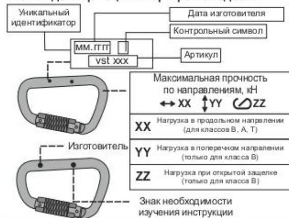
Рис. 1. Идентификация и маркировка изделия

Перед использованием данного снаряжения Вы обязаны: - Прочитать и понять инструкцию по эксплуатации. - Пройти тренировку по его применению под руководством квалифицированного инструктора. - Познакомиться с потенциальными возможностями и ограничениями по его применению. - Осознать и принять вероятность возникновения рисков, связанных с применением снаряжения. Игнорирование этих предупреждений может привести к серьезным травмам или даже смерти.