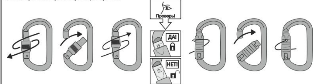
Рис. 4. Открытие / закрытие / фиксация карабина